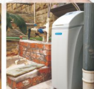
●洛阳远见水岸别墅