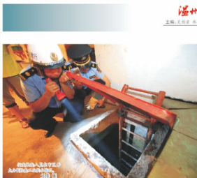
本报记者 夏忠义 通讯员 黄伟伟